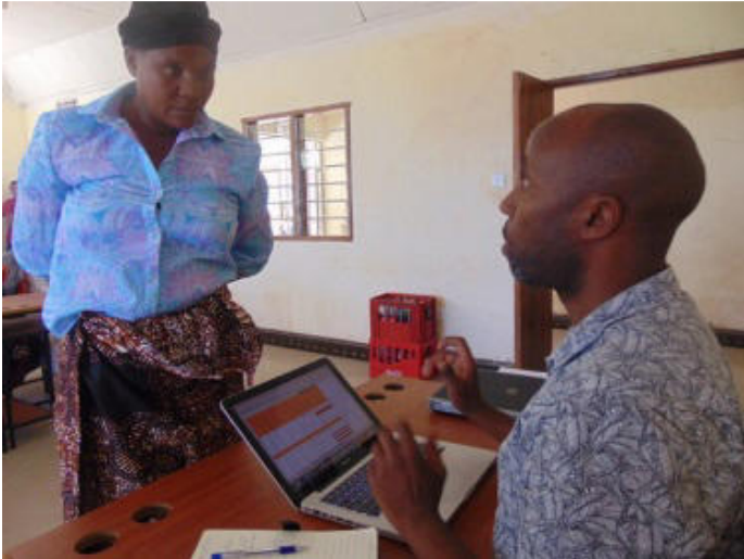
Mutter von Baraka Hussein