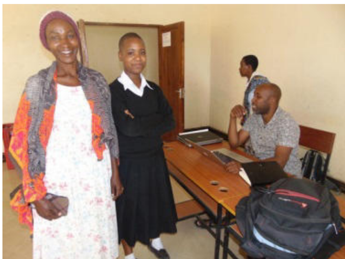
Familie Baidi – Binuru mit Mutter