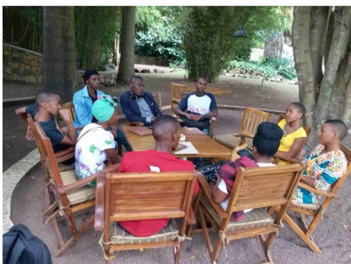
Treffen von Baraka mit Schülern am 06. März