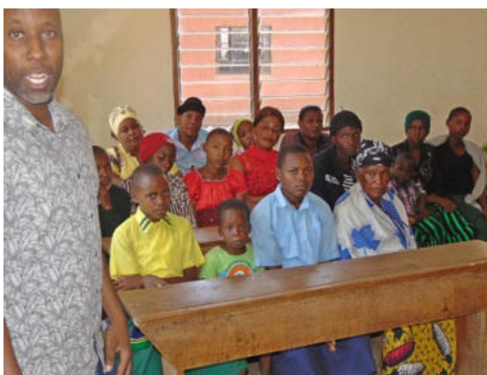
... mit über 50 Teilnehmern