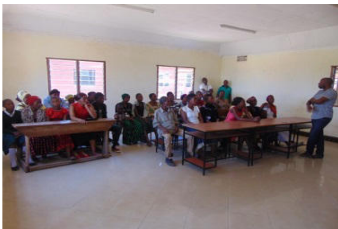
Meeting im Computerraum – Grundschule Nambala ...